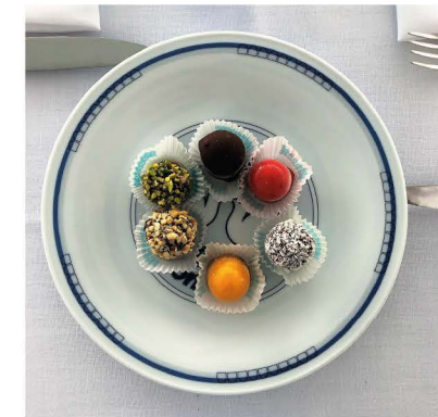
Grand Hotel Quisisana Capri