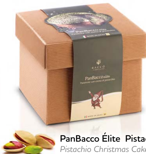
PanBacco Élite Pistacchio Pistachio Christmas Cake