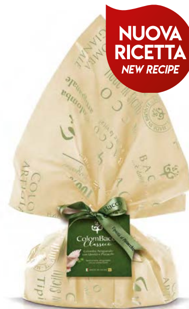
ColomBacco Rétro Classico