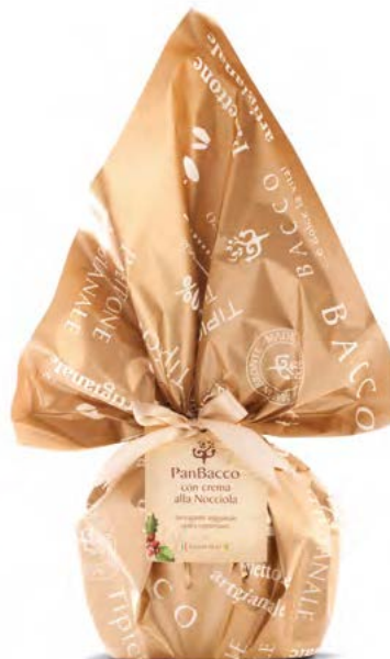
PanBacco Rétro Nocciola Hazelnut Christmas Cake