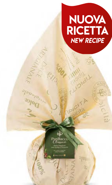
PanBacco Rétro Classico Sultanas and Pistachios Christmas Cake