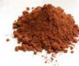
PanBacco Élite Cacao Chocolate Christmas Cake