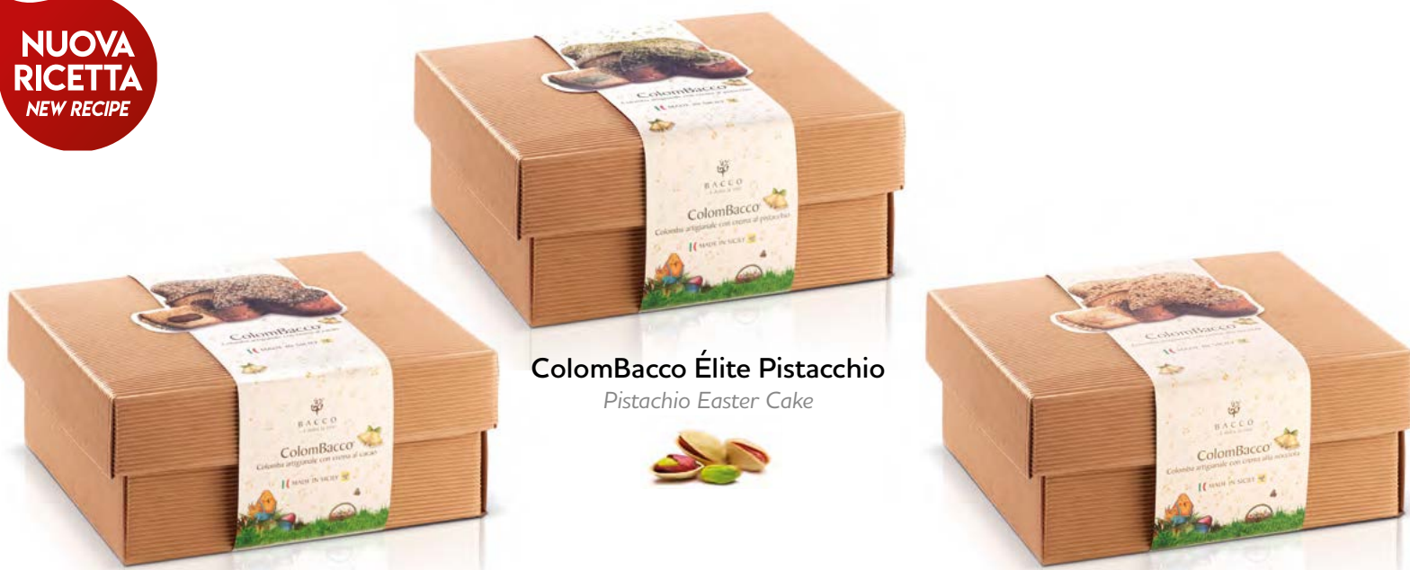
ColomBacco Élite Pistacchio Pistachio Easter Cake