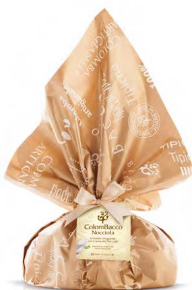
ColomBacco Rétro Nocciola