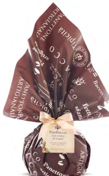
PanBacco Rétro Cacao Chocolate Christmas Cake