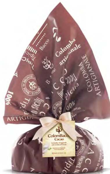
ColomBacco Rétro Cacao