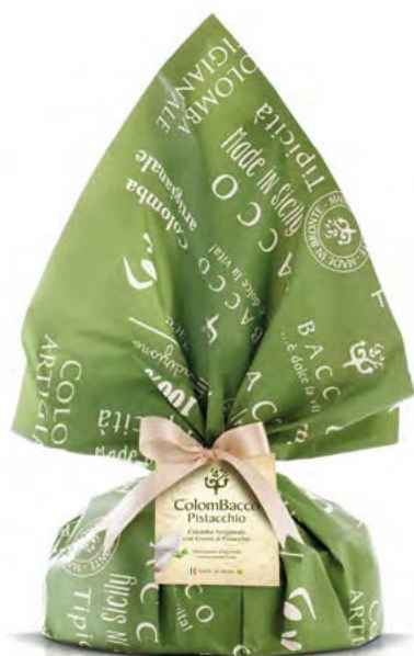
ColomBacco Rétro Pistacchio

The Rétro line is characterised by packaging care: satin paper fixed with a satin ribbon, personalised with captions “Colomba artigianale”, “Made in Sicily” and “Tipicità al Pistacchio”. Especially suited for presents.