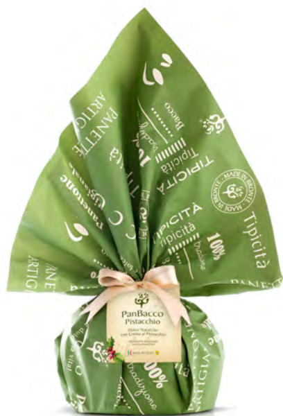
PanBacco Rétro Pistacchio Pistachio Christmas Cake

The Rétro line is characterised by packaging care: satin paper fixed with a satin ribbon, personalised with captions "Panettone artigianale", "Made in Sicily" and "Tipicità al Pistacchio". Especially suited for presents.