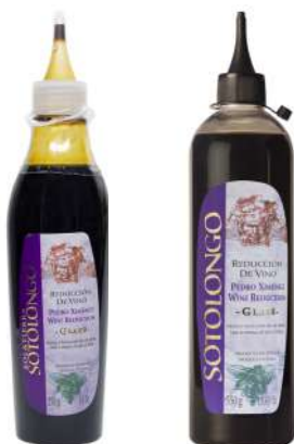
Reducción de vino Pedro Ximénez 250ml 400gr