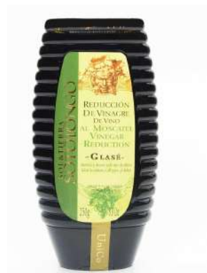
Reducción de vinagre al Moscatel 250gr