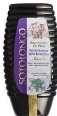
Reducción de vino Pedro Ximénez 250gr