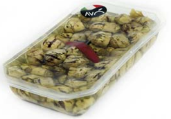
Carciofi "alla Romana" grigliati in olio di semi di girasole Artichokes "Romana style" grilled in sunflower oil