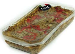
Melanzane a filetti in olio di semi di girasole Eggplant strips in sunflower oil