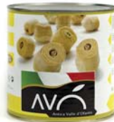
Carciofi interi al naturale Whole artichokes to natural