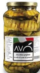
Zucchine grigliate in olio di semi di girasole Grilled zucchinis in sunflower oil