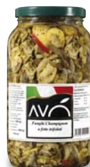
Funghi "Champignon" a fette trifolati in olio di semi di girasole Mushrooms "Champignon" sliced trifolati in sunflower oil