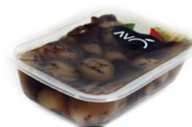
Cipolle Borettane grigliate in aceto balsamico Grilled onions Borettane in balsamic vinegar