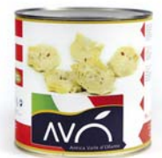
Carciofi a fettine in olio di semi di girasole Artichokes sliced in sunflower oil