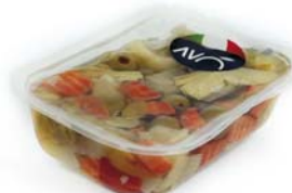
Antipasto Fantasia "Ricco" in olio di semi di girasole Appetizer Fantasy "Rich" in sunflower oil