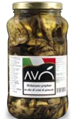
Melanzane grigliate in olio di semi di girasole Grilled eggplants in sunflower oil