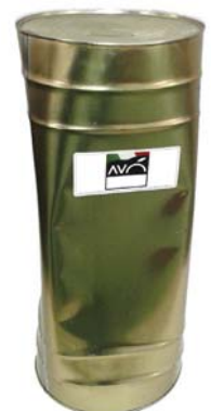
Lattone da 20 kg per prodotti semilavorati (carciofi, cipolle, peperoni, ecc.) Big tin of 20 kg for semi-finished products (artichokes, onions, peppers, etc.).