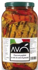
Peperoni grigliati in olio di semi di girasole Grilled peppers in sunflower oil