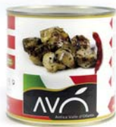
Carciofi spaccati "alla Romana" grigliati in olio di semi di girasole Artichokes cleaved "Romana style" grilled in sunflower oil