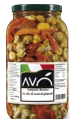
Antipasto Fantasia "Rustico" in olio di semi di girasole Appetizer Fantasy "Rustic" in sunflower oil