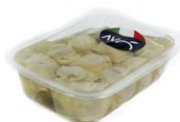
Carciofi interi alla Pugliese in olio di semi di girasole Artichokes "Pugliese style" in sunflower oil

ALTRI TIPI DI CONFEZIONAMENTO A RICHIESTA