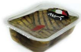
Melanzane grigliate in olio di semi di girasole Grilled eggplants in sunflower oil