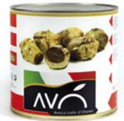
Carciofi rustici grigliati in olio di semi di girasole Rustic grilled artichokes in sunflower oil