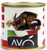
Melanzane grigliate in olio di semi di girasole Grilled eggplants in sunflower oil