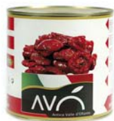
Pomodori "Cilieginò" semi-dry in olio di semi di girasole Cherry tomatoes semi-dry in sunflower oil