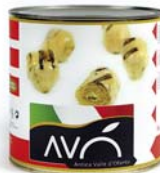
Carciofi "alla Romana" grigliati in olio di semi di girasole Artichokes "Romana style" grilled in sunflower oil