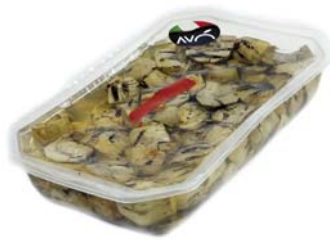
Carciofi spaccati "alla Romana" grigliati in olio di semi di girasole Artichokes cleaved "Romana style" grilled in sunflower oil