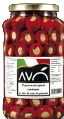
Peperoncini con tonno in olio di semi di girasole Peppers stuffed whit tuna in sunflower oil