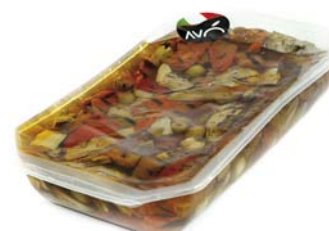
Antipasto Fantasia "Premium" in olio di semi di girasole Appetizer Fantasy "Premium" in sunflower oil