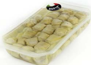
Carciofi interi alla Pugliese in olio di semi di girasole Artichokes "Pugliese style" in sunflower oil