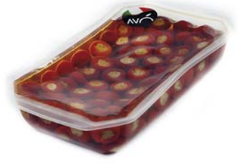
Peperoncini con tonno in olio di semi di girasole Peppers stuffed whit tuna in sunflower oil