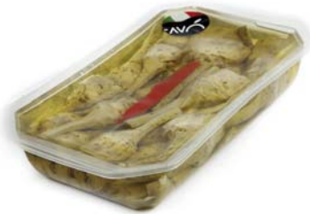
Carciofi con gambo "alla Romana" in olio di semi di girasole Artichokes whit stem "Romana style" in sunflower oil