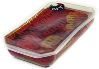
Peperoni grigliati in olio di semi di girasole Grilled peppers in sunflower oil