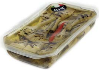
Carciofi con gambo "alla Romana" grigliati in olio di semi di girasole Artichokes whit stem "Romana style" grilled in sunflower oil