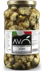
Carciofi spaccati grigliati in olio di semi di girasole Artichokes cleaved grilled in sunflower oil