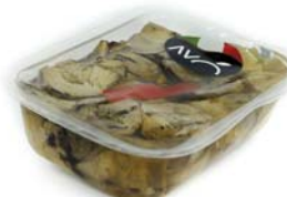
Carciofi spaccati "alla Romana" grigliati in olio di semi di girasole Artichokes cleaved "Romana style" grilled in sunflower oil