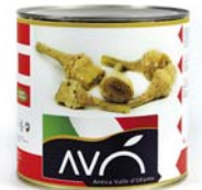
Carciofi con gambo "alla Romana" in olio di semi di girasole Artichokes whit stem "Romana style" in sunflower oil