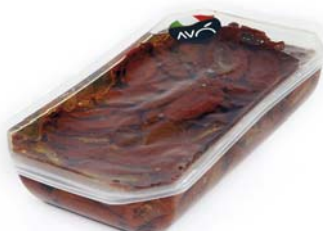
Pomodori secchi in olio di semi di girasole Dried tomatoes in sunflower oil