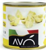
Carciofi a spicchi al naturale Artichokes quarters to natural