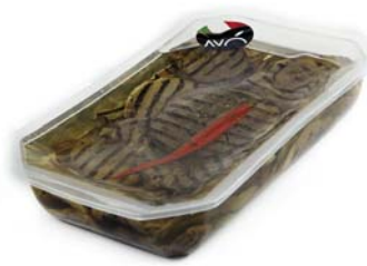
Melanzane grigliate in olio di semi di girasole Grilled eggplants in sunflower oil