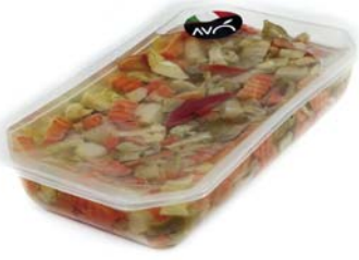
Antipasto Fantasia "Ricco" in olio di semi di girasole Appetizer Fantasy "Rich" in sunflower oil