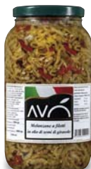
Melanzane a filetti in olio di semi di girasole Eggplant strips in sunflower oil