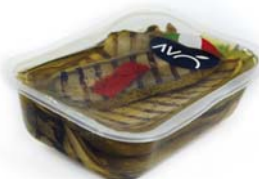
Zucchine grigliate in olio di semi di girasole Grilled zucchini in sunflower oil