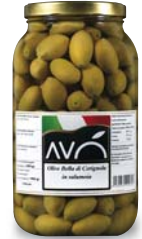
Olive "Bella di Cerignola" in salamoia Olives "Bella di Cerignola" in brine