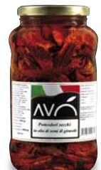
Pomodori secchi in olio di semi di girasole Dried tomatoes in sunflower oil