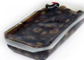
Cipolle Borettane grigliate in aceto balsamico Grilled onions Borettane in balsamic vinegar