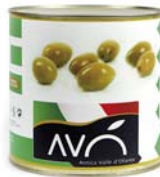
Olive "Bella di Cerignola" in salamoia Olives "Bella di Cerignola" in brine