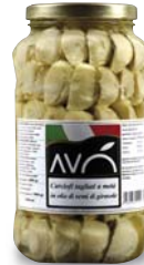
Carciofi spaccati "alla Pugliese" in olio di semi di girasole Artichokes cleaved "Pugliese style" grilled in sunflower oil

ALTRI TIPI DI CONFEZIONAMENTO A RICHIESTA