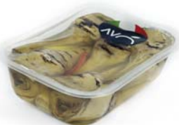
Carciofi con gambo "alla Romana" grigliati in olio di semi di girasole Artichokes whit stem "Romana style" grilled in sunflower oil