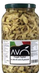
Funghi "Champignon" a fette in olio di semi di girasole Mushrooms "Champignon" sliced in sunflower oil