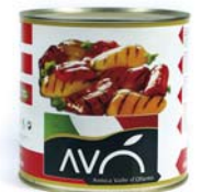
Peperoni grigliati in olio di semi di girasole Grilled peppers in sunflower oil