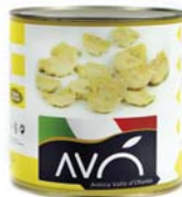
Carciofi a fettine al naturale Artichokes sliced to natural