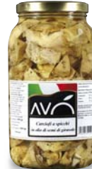
Carciofi a spicchi in olio di semi di girasole Artichokes quarters in sunflower oil