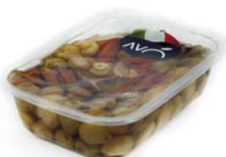
Antipasto Fantasia "Premium" in olio di semi di girasole Appetizer Fantasy "Premium" in sunflower oil