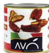
Pomodori secchi in olio di semi di girasole Dried tomatoes in sunflower oil