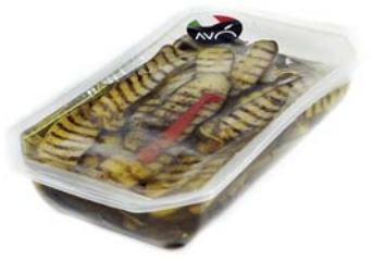
Zucchine grigliate in olio di semi di girasole Grilled zucchini in sunflower oil