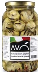
Carciofi "alla Romana" grigliati in olio di semi di girasole Artichokes "Romana style" grilled in sunflower oil