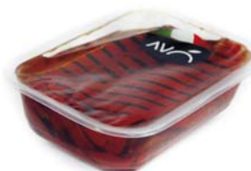
Peperoni grigliati in olio di semi di girasole Grilled peppers in sunflower oil